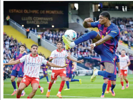
فيما تجمد رصيد جيرونا عند 6 نقاط في سباق متصل، تغلب مانشستر سيتي على ضيفه ايفرتون المركز قبل الأخير من الليغا.