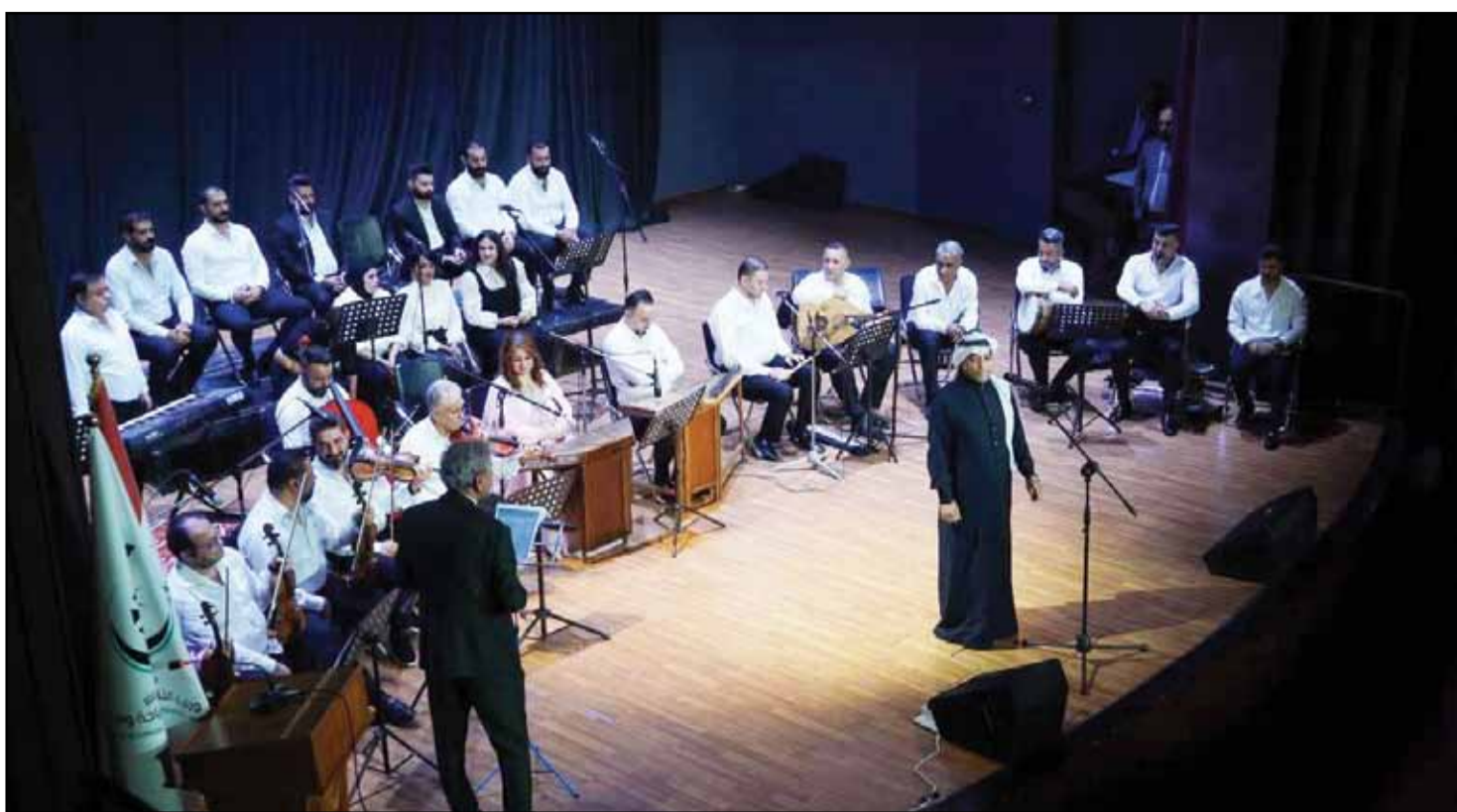
أمسية فنية موسيقية على قاعة الشعب ببغداد أمس

١٩٩٠ - الجمعية الجغرافية الملكية البريطانية تكشف عن أن المنطقة المدمرة ببثاً حول بحر آرال تمثل أسوأ كارثة بيئية في العالم.