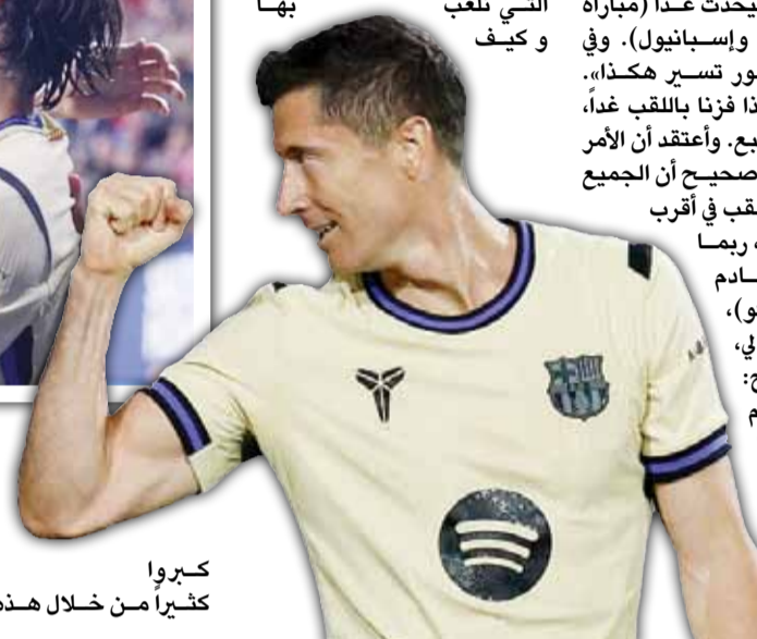
كبروا كثيراً من خلال هذه الظروف،

بما يقدمه اللاعبين». وعن فارق النقاط وتوقيت حسم اللقب، أوضح المدرب الألماني: «نحن في وضعية جيدة، كنا متقدمين بـ ١١ نقطة، والآن أصبح الفارق ١٤. سنرى ما سيحدث غداً (مباراة ريال مدريد وإسبانيول). وفي النهاية، الأمور تسير هكذا». واستطرد: «إذا فزنا باللقب غداً، سنحتفل بالطبع. واعتقد أن الأمر لا يهم كثيراً؛ صحيح أن الجميع يريد حسم اللقب في أقرب وقت ممكن، ربما الأسبوع القادم (في الكلاسيكو)، لكن بالنسبة لي، الأمر واضح: نحن نقوم بعملنا، وما عدا ذلك ليس بأهمنا». وأضاف: «نحن نؤمن بأن فريقه أصبح البطل بعد ارتفاع الفارق مع ريال مدريد إلى ١٤ نقطة، قال فليك خلال المؤتمر الصحفي بعد المباراة: «لا ليس بعد، لا علينا أن ننتظر، ربما حتى الغد، ربما الأسبوع المقبل، لا نعلم ذلك، لكننا قمنا بعملنا، وهذا ما أقدّره كثيراً في فريقنا الرائع». وأضاف فليك بالمنظومة الدفاعية للفريق أمام خصم صعب، قائلًا: «دافعنا بشكل جيد أمام خصم قوي جداً في الكرات الهوائية، خاصة مع العرضيات، فهم مميّزون للغاية في هذا الجانب، لكننا تعاملنا مع ذلك بشكل جيد، وأنا سعيد جداً».