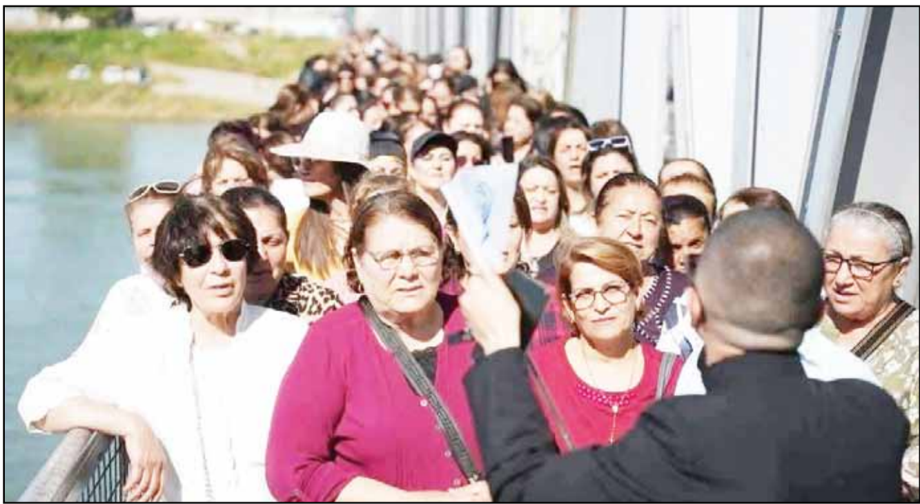
500 سيدة من بغديدا في جولة بكنائس مدينة الموصل برحلة «ملتقى المرأة السريانية»

في النهاية، قد لا تغير الكلمة العالم فوراً، وقد تسقط برصاصة قاتلة، أو شظايا صاروخ أطلقتها طائرة مسيرة، أو قذيفة مدفع، لكنها تمنع الظلام من أن يكون كاملاً، وهذا في زمن مثل زماننا، شكل من أشكال الانتصار.