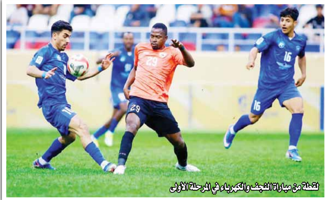
لقطة من مباراة النجف والكهرباء في المرحلة الأولى

بغداد/ متابعة الزوراء أصدر نادي النجف الرياضي بياناً بشأن الأحداث التي وافقت مباراة فريقه مع الكهرباء في دوري نجوم العراق، ذكر فيه: "لا يمكننا إغفال حجم الضغوط الاستثنائية التي أحاطت بفريقنا وكوادره هذا الموسم، وما شهدته مباراتنا أمام نادي الكهرباء الرياضي من لغط تحكيمي وقرارات أثارت استغرابنا وتحفظنا العميق، وكان ذلك شرارة لأحداث لم تكن تمنى وقوعها في المباراة".