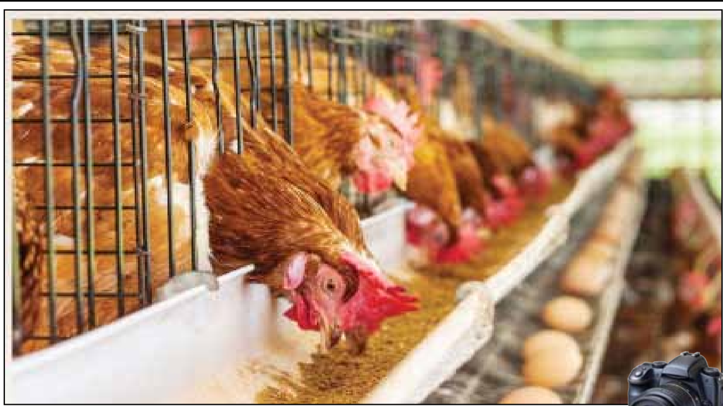
ارتفاع أسعار أعلاف الحيوانات وبيض المائدة

١٢٦٠ - قوبلاي خان يتولى حكم إمبراطورية المغول. ١٤٩٤ - المستكشف كريستوفر كولومبوس يكتشف جامايكا. ١٧٦٢ - التوقيع على «معاهدة سانت بطرسبرغ» بين الإمبراطورية الروسية وبروسيا. ١٨٠٨ - كانتون أرجاو في سويسرا يلغي مواطنة تابعي الديانة اليهودية. ١٨٣٥ - افتتاح أول خط سكة حديد في أوروبا القارية يصل بين ميشلين وبروكسل في بلجيكا. ١٨٧١ - مقتل الجهاد الجزائري محمد المقراني في ساحة القتال بالقرب من مدينة البويرة. ١٨٩٣ - انهيار سوق نيويورك للأوراق المالية مما سبب كساد اقتصادي كبير. ١٩١٦ - الولايات المتحدة تغزو جمهورية الدومنيكان. ١٩٣١ - تأسيس جمعية العلماء المسلمين الجزائريين. ١٩٣٦ - القوات الإيطالية تحتل أديس أبابا. ١٩٤٠ - اللاجئين النرويجيون أثناء الحرب العالمية الثانية يشكلون حكومة منفى في لندن. ١٩٤١ - الإعلان عن استقلال إثيوبيا وذلك بعودة الإمبراطور هيليا سيلاسي. ١٩٤٣ - تنصيب الأمين باي بن محمد الحبيب ملكاً على تونس.