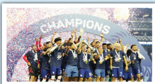
لاس فيغاس / متابعة الزوراء: