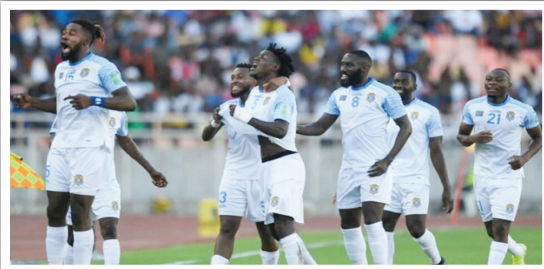
ككرة القدم، المقررة في كوت ديفوار مطلع العام المقبل، عقب فوزه له والمستحق (-٢) مضيفة منتخب الكونغو...