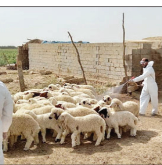
عبر لدغات البعوض أو القراد، كما ينتقل الفيروس عن الحفايش. البعوض الأخضر هو ملامسة سوائل المصاب، مثل الدم أو اللعاب أو السائل المنوي.

ويمكن انتقال عدة أنواع أخرى منها عبر استنشاق فضلات الفران المصابة. وإذا سافرت إلى منطقة تنتشر فيها حمى نزفية معينة، فقد تصاب بالعدوى من دون أن تفرص عليك الأضاحي إلا بعد عودتك إلى وطنك، وقد يستغرق ظهور الأعراض من يومين إلى ٢١ يوما حسب نوع الفيروس. الوقاية والعلاج إذا كنت تعيش في مناطق تنتشر فيها هذه الأمراض أو تعمل فيها أو تسافر إليها، فاحم نفسك من العدوى مستخدما وسائل واقية مناسبة عند التعامل مع الدم أو سوائل الجسم. كارتداء القفازات وواقيات العينين والوجه. وتشمل الاحتياطات أيضا توخي الحذر عند التعامل مع عينات المختبرات والنفايات وتطهيرها والتخلص منها. وعلى الرغم من عدم وجود علاج معين لعظم عدوى الحمى النزفية الفيروسية، فقد يساعد عقارا «ريفيرين» و«ميتازول» على تقصير مسار بعض أنواع العدوى ومنع حدوث مضاعفات في بعض الحالات.