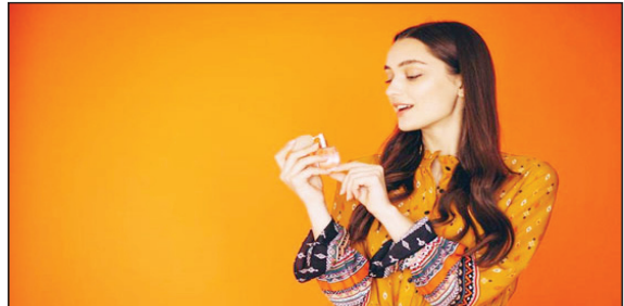
وضع العطر: اجعلي المسافة الصحيحة أنسكي زجاجة العطر على بعد حوالي ست بوصات من جسمك. وجهي الفوهة نحو جسمك. يجب أن تتأكدي من أن الزجاجة بعيدة بما يكفي عن أنسكي زجاجة العطر على بعد حوالي ست بوصات من جسمك.