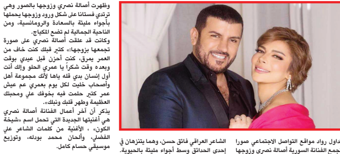
تداول رواد مواقع التواصل الاجتماعي صوراً تجمع الفنانة السورية أصالة نصري وزوجها الشاعر العراقي فائق حسن، وهما يتزانهان في إحدى الحدائق وسط أجواء مليئة بالحبوية.