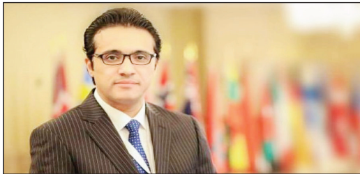
بغداد/ مصطفي الفليح: أوضحت وزارة التعليم العالي أهمية ودلالات إطلاقها لحسابات الجامعات العراقية في مستوعب سكوباس العالمي، فيما أكدت أنه سيتيح معرفة مدى تفاعل الباحثين في العالم مع رصيد البحث العلمي العراقي.

هذا المستوعب، ولدينا أكثر من 300 مجلة علمية تخصصية لها تاريخ يمتد إلى عقود من الزمن، وأخبارا وإشادات الضمير العالمي جزة منه يتعلق بالإنسان، ولكن جامعاتنا حقت نسبة من الضمير الإيجابي في هذه المستوعبات، والعمل جار على التحاق كل المجالات العراقية التي تربطها بالجامعات العراقية في هذه المستوعبات.