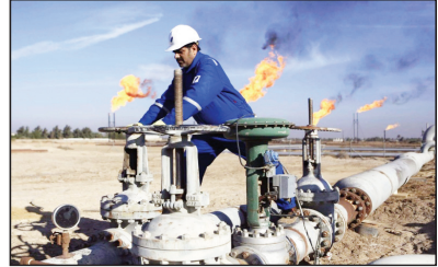
بغداد / الزوراء: حقق خام البصرة على مكاسب اسبوعية ثانية على التوالي بعد ان قلصت السعودية وروسيا الاعدادات وهبطت مخزونات الخام الامريكى. واغلق خام البصرة الثقيل في آخر جلسة له من يوم الجمعة على ارتفاع بلغ 72 سنتا ليصل الى 73.77 دولارا، وسجل مكاسب اسبوعية بلغت 1.75 دولار بما يعادل 2.43%.

فيما اغلق خام البصرة المتوسط في اخر جلسة له على ارتفاع ايضا بلغ 72 سنتا ليصل الى 75.17 دولارا، وسجل مكاسب اسبوعية بلغت ايضا بلغت 1.75 دولار او ما يعادل 2.33%. أما خام برنت فقد اغلق في آخر جلسة له من يوم الجمعة على ارتفاع بمقدار 1.95 دولار ليصل الى 78.47 دولار، وسجل مكاسب اسبوعية بلغت 3.57 دولار او ما يعادل 4.77%.