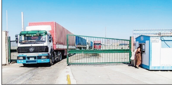
بغداد / الزوراء: بغداد / الزوراء: ذكرت صحيفة "طهران تايمز" الإيرانية الصادرة بالانكليزية، امس السبت، ان ادارة المصارف الإيرانية أعلنت عن تصدير سلعاً غير نفطية بقيمة 2.3 مليار دولار الى العراق خلال ثلاثة اشهر.

وأشار التقرير الإيراني الذي اطلعت "الزوراء" على ترجمته: ان العراق كان ثاني أكبر وجهة متلقية للسلع غير النفطية خلال فترة الأشهر الثلاثة الأولى من السنة التقويمية الإيرانية الحالية (21 آذار / مارس - 21 حزيران / حزيران). ونقل التقرير عن مسؤول من منظمة ترويج التجارة الإيرانية، قوله ان قيمة صادرات إيران الى العراق، نمت بنسبة 15% خلال السنة الإيرانية الماضية 1401 (المنتهية في 20 آذار / مارس الماضي). وبحسب المدير العام لمكتب منظمة ترويج التجارة الإيرانية لدول غرب اسيا فرزاد بيلتان، فإن البيانات الصادرة عن ادارة الجمارك، تظهر ان ايران صدرت سلعاً تزيد قيمتها على 10 مليارات دولار الى جاراتها