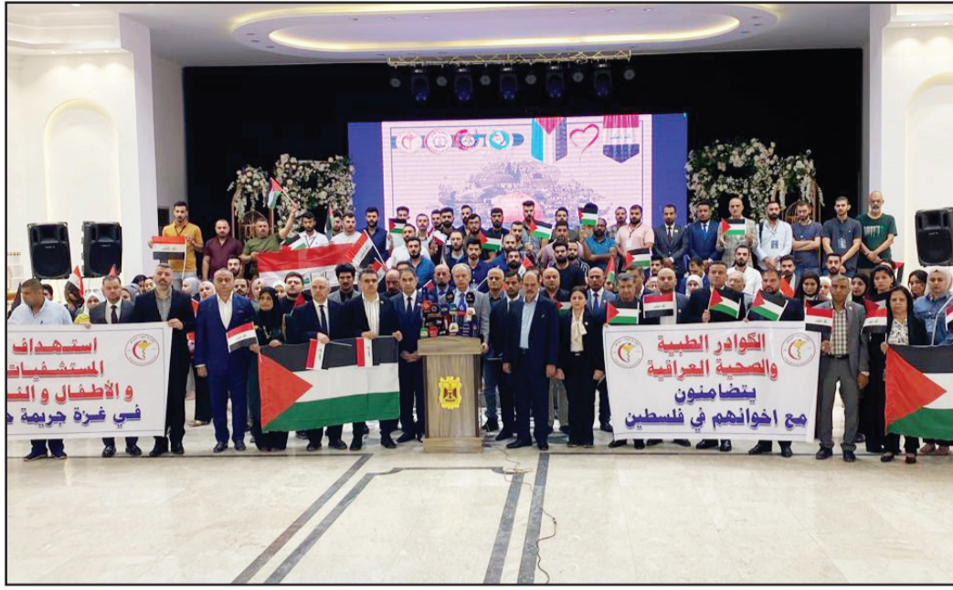
استهداف الأطفال والنساء في غزة جريمة ضد الإنسانية

بغداد/ الزوراء: أعلن رئيس اتحاد الصحفيين العرب نقيب الصحفيين العراقيين مؤيد اللامي، مقتل 16 صحفياً واصابة العشرات بنيران قوات الاحتلال الاسرائيلية في فلسطين، وفيما اشار الى انه سيتم اللجوء الى المحاكم الدولية لمحاسبة قادة الصهاينة، أكد ان الامانة العامة لاتحاد الصحفيين العرب ستتخذ قرارات قوية خلال اجتماعها الطارئ الذي سيعقد في القاهرة اليوم الاحد.