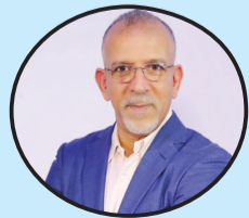
حفيظ الدراجي معلق رياضي

المواطن الفرنسي المسلم من أصول جزائرية كريمة بنزيمة، فتعرض بدوره لحملة انتقادات شرسة من طرف الساسة في وسائل الإعلام، بسبب منشور أبدى فيه تعاطفه مع ضحايا الحرب على غزة، بلغت درجة اتهامه بالانتماء الى جماعة الاخوان المسلمين، وضرورة سحب الجنسية الفرنسية منه..