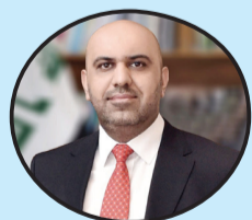
هشام الركابي مستشار رئيس الوزراء

كلمة رئيس الوزراء السيد محمد شياع السوداني في قمة القاهرة حول تطورات الأوضاع في #غزة أظهرت مواقف العراق الحازمة من قضايا العرب المصرية وعلى رأسها القضية الفلسطينية.