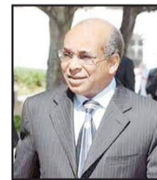
عبد الرحمن شلقه وزير خارجية ليبيا السابق

أي متابع لتغطية وسائل الإعلام المختلفة، العربية والعالمية، لأحداث حرب غزة التي بدأت بعملية «طوفان الأقصى» يوم السابع من أكتوبر (تشرين الأول) الحالي، ثم امتدت لتصبح حرب دمار شامل ضد قطاع غزة وسكانها، سيندهش للمفارقة الواضحة في تغطية كبريات القنوات العالمية، مثل «سي إن إن»، و«بي بي سي»، و«فوكس نيوز»، والصحف الأميركية والأوروبية، عن تغطية القنوات ووكالات الأنباء والصحف في المنطقة العربية والإسلامية. وسيزداد الاندهاش عند متابعة ردود فعل ساسة وقادة الدول الغربية بشكل عام؛ الولايات المتحدة ودول الاتحاد الأوروبي، ودول أوروبا الشرقية، فالموقف الموحد هو إدانة هجوم حركة «حماس» على إسرائيل وعده عملية إرهابية، وإعطاء إسرائيل ضوءاً أخضر لشن حرب شاملة على غزة بحجة حقها في الدفاع عن النفس. ثم وفي الوقت نفسه، هناك تجاهل كامل للهجمات الإسرائيلية على غزة التي أدت لسقوط أكثر من ثلاثة آلاف شهيد، وإهمال التغطية الإعلامية لها، وأخيراً قبول التفسير الإسرائيلي لمذبحة المستشفى المعمداني في جنوب غزة، حسبما صرح الرئيس الأمريكي جو بايدن في تل أبيب مخاطباً نتنياهو: «يبدو لنا أن المسؤول عن مذبحة المستشفى هم أنفسهم، وليسوا أنتم.» بعد عبور مرحلة الدهشة والاستغراب، تبدأ مرحلة بحث