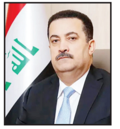
محمد شياع السوداني رئيس الوزراء العراقي

أسفر عن سقوط آلاف الشهداء جراء العدوان الصهيوني وانطلاقاً من وعي الحكومة بضرورة أن يضطلع العراق بدوره التاريخي في المنطقة، انخرطت بغداد في محادثات جادة منذ اللحظة الأولى لاندلاع الصراع في الأراضي الفلسطينية المحتلة. فقد أجرينا سلسلة من المحادثات الهاتفية مع القادة العرب، أكدنا فيها على أهمية وحدة الموقف العربي والإسلامي إزاء ما يتعرض له الفلسطينيون، وأيضاً على ضرورة وقف التصعيد واحترام حقوق الإنسان، والضغط على الكيان الصهيوني حتى يوقف عدوانه على الأراضي المحتلة، والبدء في مفاوضات تفضي إلى وقف القتال والشروع في إيجاد حلول عملية بما ينصف الشعب الفلسطيني. وركزنا في محادثتنا الهاتفية مع الرئيس الأمريكي جوزيف بايدن على الجهود الجارية لمنع توسع الصراع في غزة، وشددنا على أهمية إيقاف القصف على القطاع، ومعالجة الأزمة الإنسانية المتفاقمة في غزة، وفتح الممرات وإيصال ما يحتاج إليه أهالي القطاع الذين يتعرضون لحرب وحصار ظالم. واستمرنا في زيارتنا إلى العاصمة