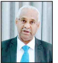
فيصل محمد صالح وزير الإعلام السوداني السابق

جديدة تحاول معرفة لماذا اختلفت المواقف والتفسيرات، لماذا يعجز العالم عن إيجاد رؤية واحدة لما حدث، رغم الجهود الكبيرة المبذولة منذ سنوات لمحاولة إيجاد معايير وقيم إنسانية يجمع حولها كل سكان العالم ودوله ونخبه الحاكمة. هناك تفسير قديم حول سيطرة اللوبي الصهيوني على الإعلام العالمي، وقدرته على التأثير على سياسات الدول الغربية، وقوة نفوذ اللوبي اليهودي في السياسة الأمريكية مع قرب الانتخابات الرئاسية. هذا التفسير ليس خاطئاً تماماً، لكنه لا يصلح وحده لرؤية الصورة كاملة. أخطر ما يظهره هذا التباين أن العالم ينقسم إلى كتل تختلف في تقديراتها ورؤيتها للأشياء وبالتالي مواقفها، وهو عين ما سماه الأكاديمي والمفكر الأمريكي صموئيل هنتنغتون صراع الحضارات، في مقاله الشهير الذي حوله بعد ذلك لكتاب حمل عنوان «صدام الحضارات وإعادة تشكيل النظام العالمي». كان هنتنغتون يرد على تلميذه فرنسيس فوكوياما صاحب كتاب «نهاية التاريخ وأخر البشر» الذي تحدث بعد سقوط الاتحاد السوفياتي بأن النظام الرأسمالي قد انتصر نهائياً على الأيديولوجية الماركسية، ودانت له السيطرة على العالم. جادل هنتنغتون بأن الصراع الأيديولوجي بين الرأسمالية والشيوعية قد انتهى، وأن صراعات ما بعد الحرب الباردة لن تكون بين الدول القومية واختلفات السياسية والاقتصادية، بل ستكون الاختلافات الثقافية والدينية المحرك الرئيسي للنزاعات بين البشر في السنين المقبلة، وسيكون هناك صراع ثقافي وديني بين الحضارات المتعددة: الحضارة الغربية المسيحية من جهة والحضارة الإسلامية من جهة أخرى، وقسم العالم لكتل حضارية مثل الحضارات