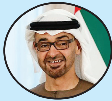
محمد بن زايد رئيس دولة الامارات

أهنئ الفائزين بجائزة زايد للاستدامة الذين كرمناهم بمقر (كوب28) في مدينة إكسبودي. تحمل الجائزة اسم شخصية عالمية رائدة في مجال دعم الاستدامة داخل الإمارات وخارجها، وعلى مدى السنوات الماضية مثلت منصة ثرية لدعم الجهود والرؤى والأفكار من أجل مستقبل أفضل للبشرية.