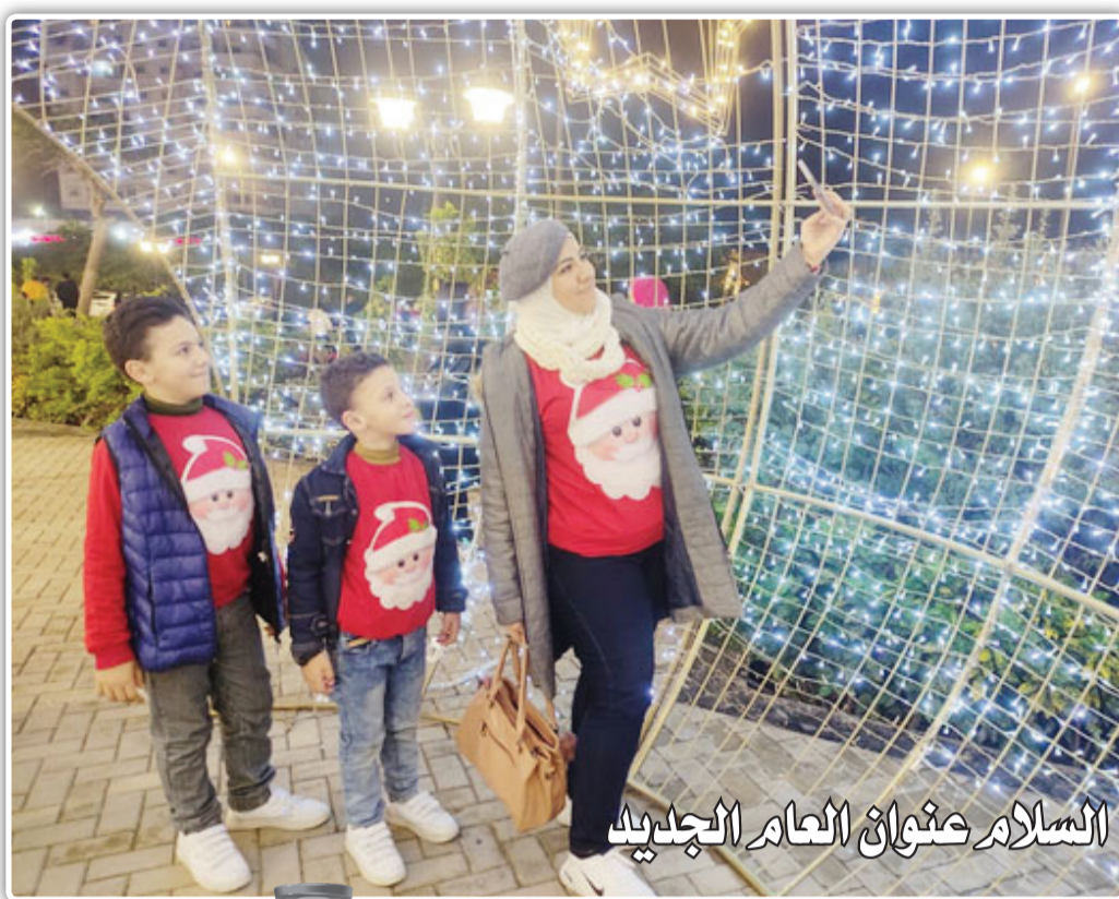
السلام عنوان العام الجديد