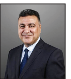
ياسر عبد العزيز كاتب وخبير اعلامي مصري

يبداً أن تلك الإجابة على قصرها وكثافتها تختصر بالفعل السبب الذي يؤدي إلى رواج عمل المنجمين: أي الضعف الإنساني، الذي يحمل بعض الناس على اللجوء للمنجمين