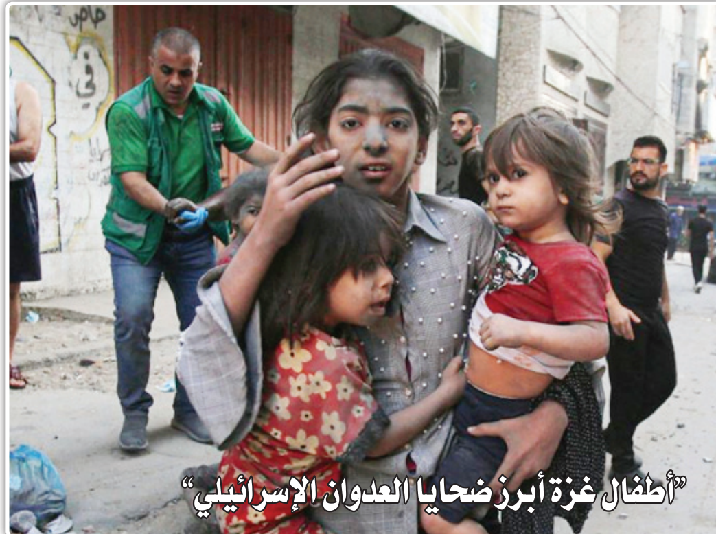
اطفال غزة أبرز ضحايا العدوان الإسرائيلي