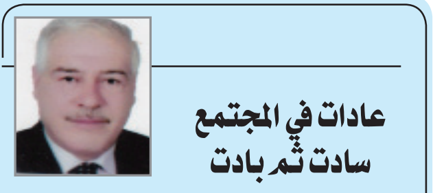
عادات في المجتمع سادت ثم بادت