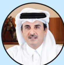
تيمير بن حمد