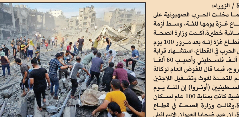
بغداد/ الزوراء: بينما دخلت الحرب الصهيونية على قطاع غزة يومها المئة، وسط أزمة إنسانية خطيرة، أكدت وزارة الصحة في قطاع غزة إنه بعد مرور 100 يوم على الحرب في القطاع، استشهاد قرابة 24 ألف فلسطيني وأصيب 60 ألفاً بجروح، فيما قال المفوض العام لوكالة الأمم المتحدة لغوث وتشغيل اللاجئين الفلسطينيين (أونروا) إن المئة يوم الماضية كانت بمثابة 100 عام لسكان غزة. وقالت وزارة الصحة في قطاع غزة، أن عدد ضحايا العدوان الإسرائيلي