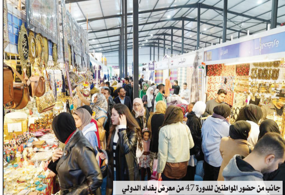
جانب من حضور المواطنين للدورة 47 من معرض بغداد الدولي

التحول «سيمثل هدفاً استراتيجياً للدولة في المرحلة المقبلة يتماشى مع خواص العراق فالموارد الشمسية وشمح الطاقة الكهربائية والحاجة لها والمرونة في إنتاج الكهرباء فاليوم حتى الفلاح يستطيع أن يستقل بإنتاج كهربائه بواسطة ألواح شمسية ويقوم بسحب المياه وتوفير الإضاءة والتكييف من الطاقة الشمسية وحتى بالوحدات المنفصلة الصغيرة التي لا تحتاج توصيل كهربائي في كل مكان فيحدث استقلال في إنتاج الكهرباء وهذا مهم جداً ويخفف من أعباء كبيرة»، مضيفاً أنه «في الوقت نفسه يساعد على التنمية ويدفع النمو الاقتصادي بشكل جيد متسارع وغير محسوس لكونه مدخلاً إنتاجياً غير مرئي لكنه مهم وكبير». وعن دعم الدولة للمواطن في هذا التوجه، أكد أن «هناك برنامجاً كبيراً للبنك المركزي لدعم المشاريع المنتجة لأجهزة الطاقة الشمسية عبارة عن قروض ميسرة جداً وفي الوقت نفسه الدولة أطلقت برنامجاً اقراضياً لدعم مشاريع إنتاج الألواح الزجاجية وهناك شركة مشتركة حكومية مع القطاع الخاص تأسست بهذا الاتجاه، وهذا جزء من دعم القطاع الخاص بمساعدة الدولة».