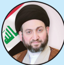
السيد عمار الحكيم

سعداء باستضافة النسخة ١٨ من بطولة كأس آسيا «قطر ٢٠٢٣» وهي تمثل قارتنا الآسيوية بتنوعها السكاني وثرائها الثقافي العريق.. نرحب بجميع المنتخبات الآسيوية المشاركة في البطولة، ونرجوها حظاً موفقاً ومقاماً طيباً في قطر، ولجماهير الكرة تجربة استثنائية.