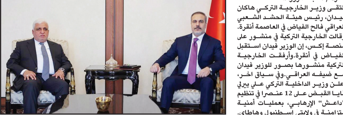
القبض على 12 إرهابياً بينهم 5 أجناب في عملية «بوزدوغان-4»، وأكد على «عدم التسامح مع الإرهابيين ومواصلة الجهود في مكافحة الإرهاب دون التراجع».

وزير الخارجية التركي يلتقي رئيس هيئة الحشد الشعبي