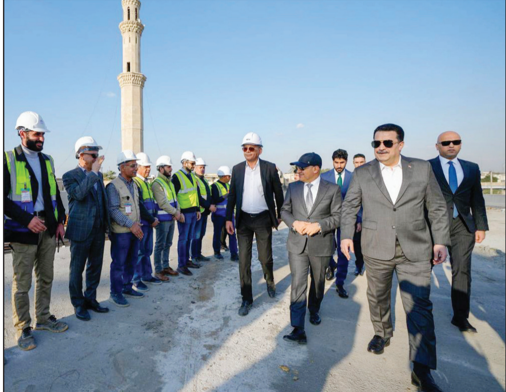
وقّع بامتداد شارع بورسعيد بعد نفق ساحة الطيران، عبوراً فوق طريق محمد القاسم السريع في

الوزير محمد شيع شياح السوداني المشاركة في تنفيذ مشروع مترو بغداد. وقال المكتب الإعلامي لرئيس الوزراء في بيان تلقته «الزوراء»: إن «رئيس مجلس الوزراء محمد شياح السوداني استقبل، ممثلي شركة (China Railway) الصينية التي تنفذ مشروع تطوير ساحة النسر وسط بغداد، ضمن الحزمة الأولى لمشاريع فك الاختناقات المرورية في العاصمة بغداد». وأضاف أن «الشركة الصينية قدمت خلال اللقاء الذي حضره عدد من مستشاري رئيس مجلس الوزراء، شرحاً عن إمكانياتها وقدراتها المتوفرة التي تمكنها من المشاركة في تنفيذ مشروع مترو بغداد الذي أعلن عنه مؤخرًا، والخبرات المتوفرة لديها للإسهام في تنفيذ هذا المشروع الحيوي المهم». وأكد أن «26 شركة عالمية من ألمانيا وإيطاليا وإسبانيا والصين والهند وقطر، أبدت رغبتها بالمشاركة في تنفيذ مشروع المترو، بعد الإعلان عنه في الثامن من شهر شباط الجاري، وتوقيع العقود مع الشركة المختصة بتقديم الخدمات الاستشارية للمشروع».