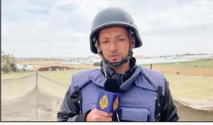
في غزة، ترميما لجروح الساق اليسرى وإضافة لإصلاح أوتار الكاحل اليسرى. ويحتاج إسماعيل لرعاية طبية متخصصة وسط مخاوف من حدوث

التهابات، بسبب جروحه الخطيرة والتهتكات في الشرايين والأوردة. يأتي ذلك، فيما لا يزال المصور الصحفي أحمد مطر يرقد في غرفة العناية المركزة موصولاً بأجهزة التنفس الاصطناعي. ويصف الأطباء الوضع الصحي لمطر بالخطير، نتيجة إصابته بشظايا في الرأس بعد استهدافه والزميل أبو عمر بقصف إسرائيلي شمال مدينة رفح. ويلحق إسماعيل، بمراسل الجزيرة الآخر ورئيس مكتبها في غزة وائل الدحود، الذي انتقل إلى العوذة لتلقي العلاج بعد استهدافه في غارة إسرائيلية في وقت سابق.