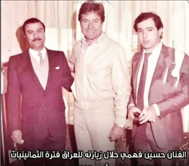
الفنان حسين فهمي خلال زيارته للعراق فترة الثمانينات يتوسط الفنان محمود أنور والفنان القدير ياس خضر

يمتلك اي معلومات عامة لن يستطيع تكلمة اي حوار ويكون مرتبك اثناء اللقاء فمسؤولية النجم كثيرة وكبيرة يجب الحفاظ عليها والانضباط بها . -ما هو انطباعك عن جمهورك العراقي ؟ - اظن ان محمود أنور فنان معروف كثيرا عند الجمهور في فترة نجوميتي وانا متواجد بوطني العزيز قبل مغادرتي عنه ورحبني وهو يستطيع ان يتحدث عن ما قدمت وماذا انجزت من اعمال واغاني مازالت في ذاكرة الجمهور وحتى الجيل الحالي الذي كثير منهم يسمع ويستمتع بهذه الاغاني وكثير من فنانين هذا الجيل يغني اعمالهم في المرافق السياحية والنوادي هذا دليل للمتميز الجميل والاغاني المؤثرة والتي بقيت بذاكرة المستمع ويطلبها لحد الان هذه واحدة مما قدمته ما على صعيد الوسط الفني اعني زملائي في مجال العمل ممكن تسأل اكثر فنان كان يعطي حقوق الشاعر والملحن والعازف اقصد حق المادي هو انا عن ابداعه لعمل انا نفذته طبعاً كل شيء في وقته وهو قليل بحقهم محبتي لهم واحترامي واذكر حالة عملتها مميزة لن يعملها زميل او مطرب اخر وانا في قمة النجومية حينما اسمع صوت شاب جميل غير معروف كنت ادعمه فنيا واقتصاديا لتسجيل اغنية ويستمر بها واصبحوا . -نجومنا في التسعينات تحياتي لهم . -حدثنا عن ظروف سفرك الى الكويت