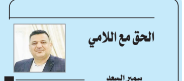
الحق مع اللامي

نيويورك/ متابعة الزوراء: بينما تواصل احتجاجات الطلاب في جامعة كولومبيا في نيويورك، يحصل الإعلام الأميركي تقديم معلومات وأخبار منجزة، بهدف تصوير المحجطين والمعاداة للساميين الداعمين لهذه التحركات، ك«معادين للسامية». اعتقالات في جامعة كولومبيا وكانت الشرطة الأميركية قد اعتقلت نحو مائة طالب داعم للفلسطينيين في قطاع غزة، كانوا قد بدأوا احتلال واجات جامعة كولومبيا، بعد يوم من مداخلته لرئيسة الجامعة نعمت طلعت بشيوع في كولومبيا، فإفقت فيها عن نفسها من اتهامات بمعاداة السامية في المؤسسة التعليمية. وأعلن رئيس بلدية نيويورك إريك أدامز، الذي يتبع سلطة على الشرطة في المدينة أن «رجال الشرطة تدخلوا لضمان سلامة الحرم الجامعي والطلاب والموظفين والأول معاً بأكثر من ١٠٨ عمليات اعتقال وتكادوا من أنه لم تحدث أي أعمال عنف أو إصابات». واحتجاجاً على حرب الإبادة التي شنها إسرائيل على غزة، طالب بؤرؤء الطلاب بجامعة كولومبيا في نيويورك بترسيم تبادل مع لبنان، مقاطعة جميع الأنشطة الطلابية بدولة الاحتلال، وجاءت الاعتقالات بتهمة «التعدي علىمتلكات الفرغ» وقد تفككت مشرات من الخيام التي نصب الأرياء في حدائق الحرم الجامعي، وقد جذبت عشرات المتظاهرين الآخرين إلى تواجدهم مع الشرطة خارج محيط الجامعة. كل ما سبق، استغلته الإعلام الأميركي بمختلف اتجاهاته السياسية،