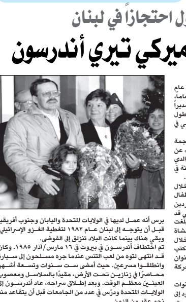
برس عمل لديها في الولايات المتحدة واليابان وجنوب أفريقيا قبل أن يتوجه إلى لبنان عام ١٩٨٢ لتغطية الغزو الإسرائيلي، وبقى معتقاً بأن سوريا كانت جبهة مستعدون لتحريره من سيطرة وانطلقوا من فوق، بعد أن أفضى سجنه ست سنوات وتسعة أشهر مضامراً في تزيان تحت الأرض، مقيماً باللاسلاسل ومعزول عن العينين معظم الوقت، وبعد إطلاق سراحه، عاد أندرسون إلى الولايات المتحدة ودرس في عدد من الجامعات قبل أن يتقاعد منذ نحو عقد من الزمن.